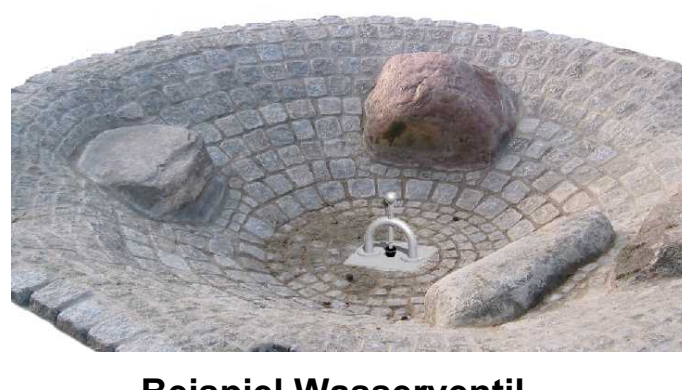
Beispiel Wasserventil in Mulde