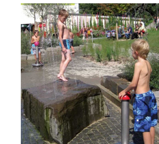
Beispiel Fontänenstein mit Druckknopf