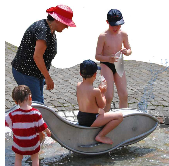
Beispiel Kleiner Wal