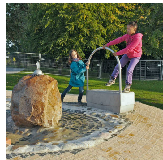
Beispiel Wipp-Saug-Pumpe mit Quelle